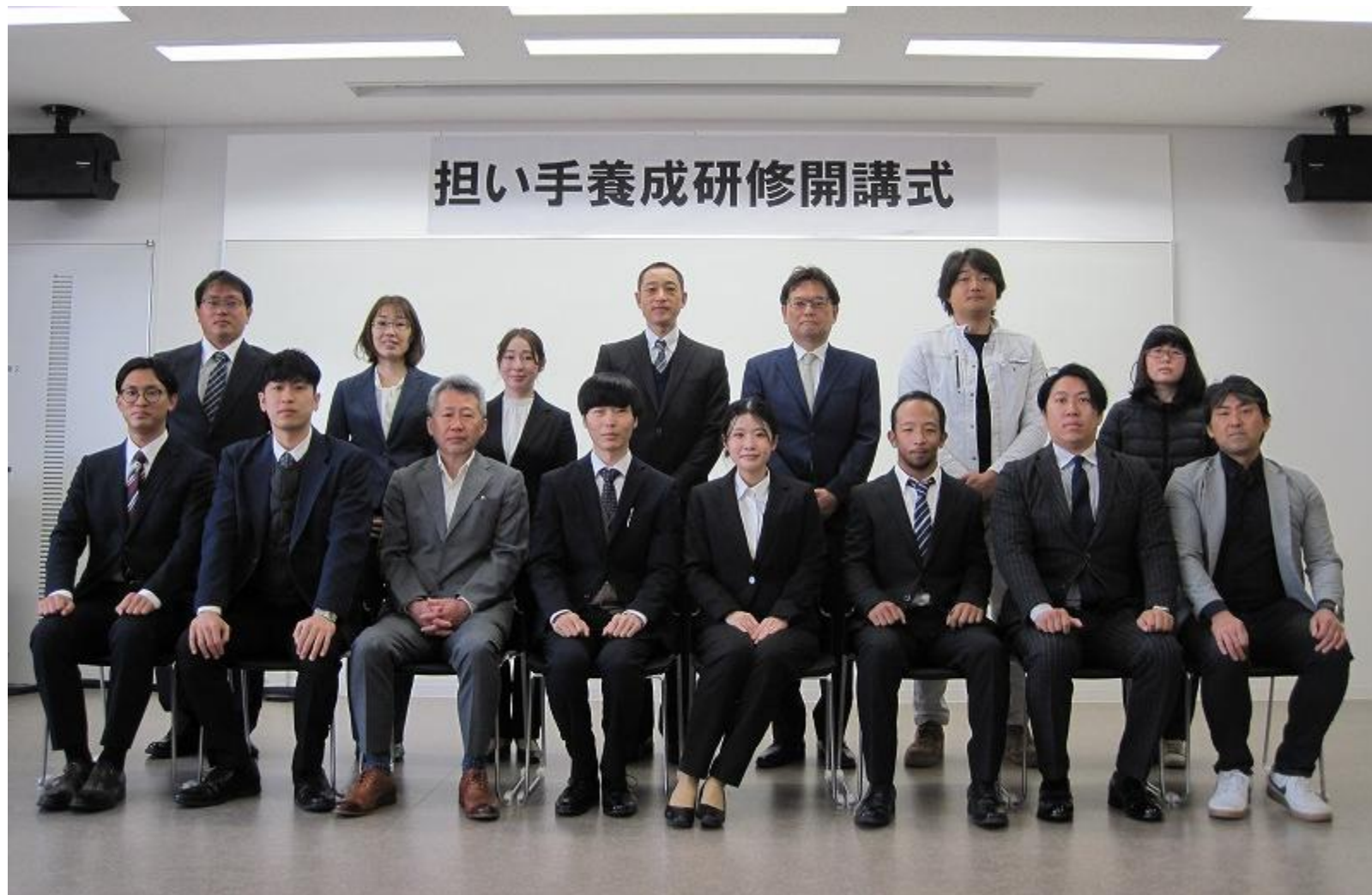
R8年度担い手養成研修生のみなさん