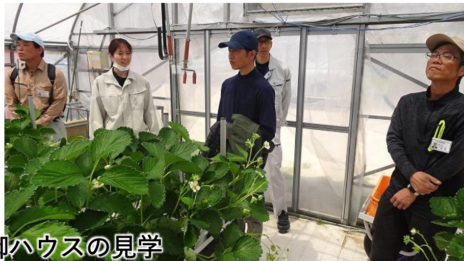
環境制御ハウスの見学