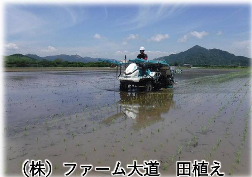
(株) ファーム大道 田植え