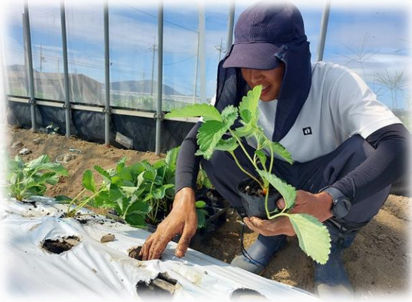
イチゴ・アスパラガス専門