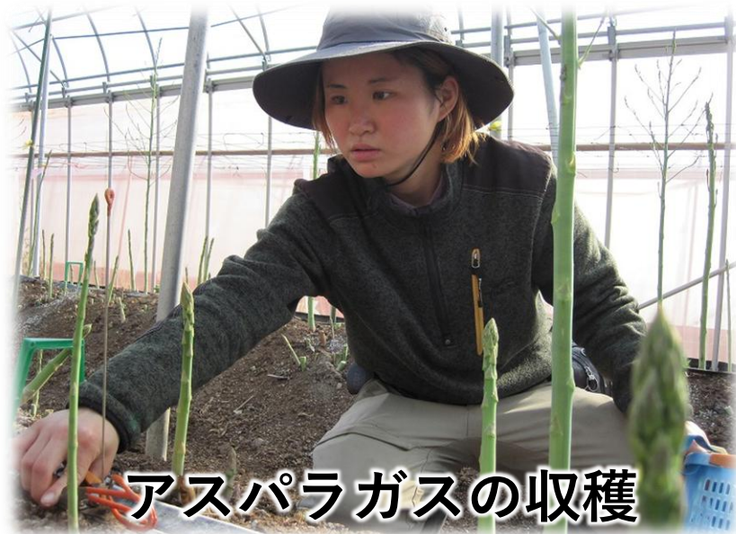
アスパラガスの収穫