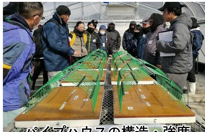
パイプハウスの構造・強度