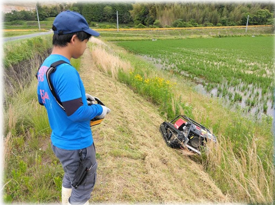
ラジコン草刈り機