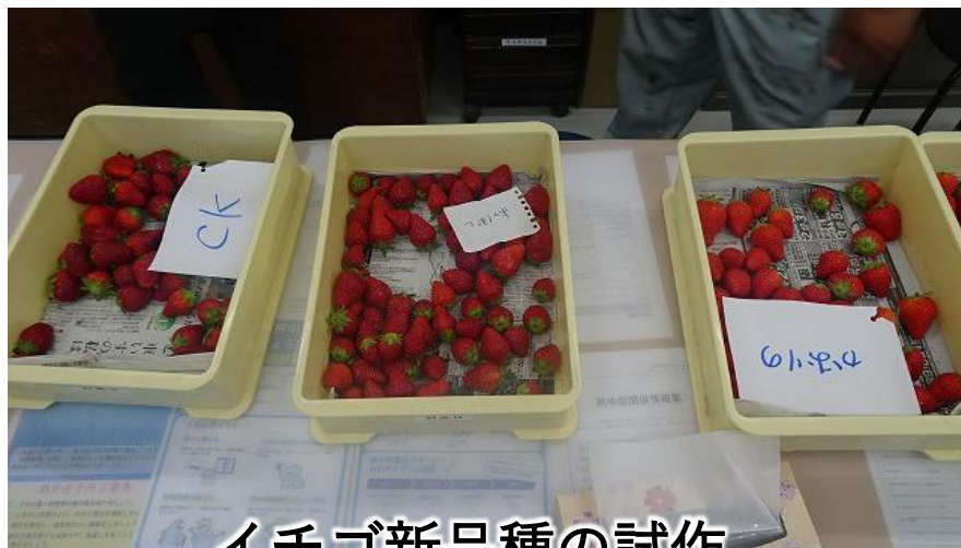
イチゴ新品種の試作