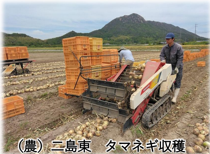
(農) 二島東 タマネギ収穫