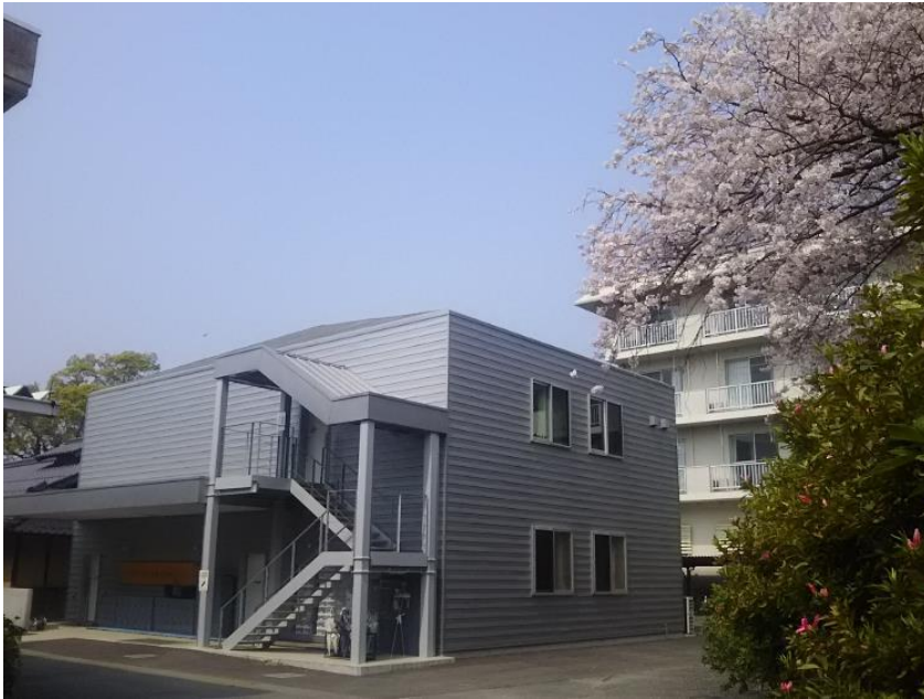
移住就農促進センター（新生館） （トイレ、シャワー、ミニキッチン完備）