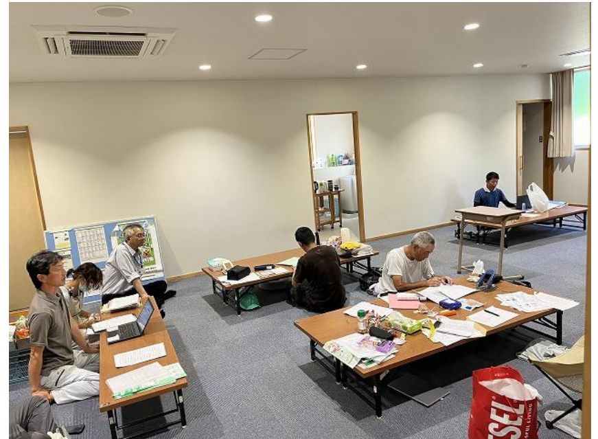
男女別の休憩室 （終礼の様子）