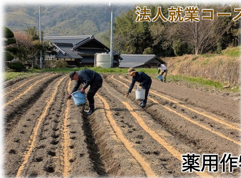
薬用作物播種作業