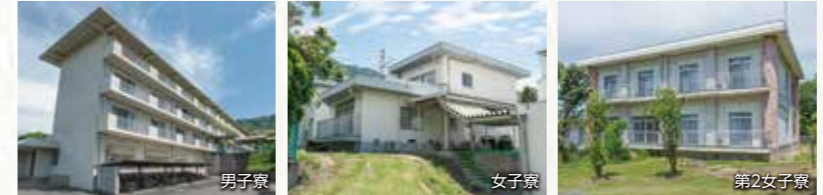
○食堂で栄養バランスの整った1日3食を提供 ○アルバイト可(申請制) ○共同スペースあり ○冷暖房、Wi-Fi完備

また、相談の上アルバイトも可能(申請制)で、休日は実家に戻ったり、外泊することもできます。学生たちは、寮生活を通じて学業と生活の両立を図り、共に成長する充実した学校生活を送っています。